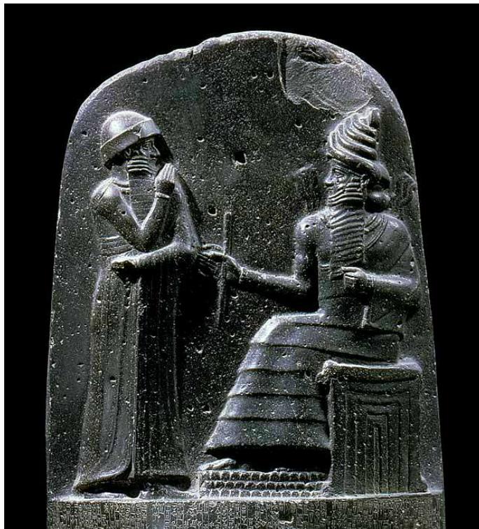
Vrchní část zákoníku

Legendy o životě královny Semiramis - vznikaly již za jejího života. Byla pokládána za dceru bohyně Derkety, kterou si pro její chytrost a krásu vzal za ženu úředník Onnes. Po smrti svého muže převzala vládu a nechala v Babylónu vybudovat řadu honosných staveb. Vedla vojska až do Indie, ale prohrála rozhodující bitvu. Legendy vytýkaly královně zhýralý život a nemorálnost. Měla dokonce usilovat o život vlastního syna. Po nezdařeném atentátu se vzdala trůnu a odešla k bohům.